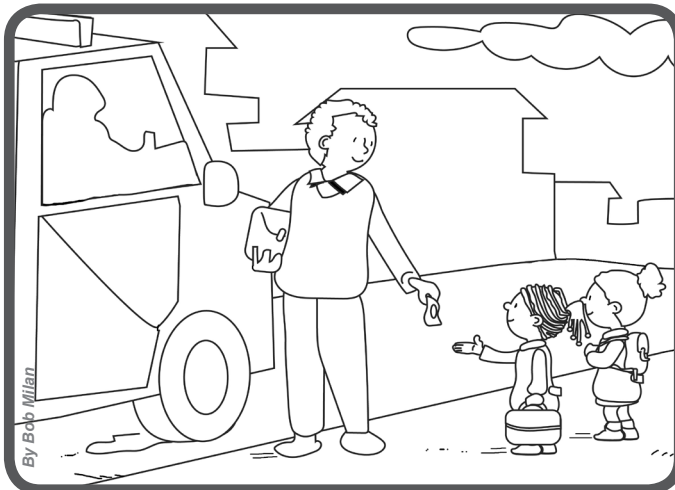
« indo à escola, eu estava mesmo com fome. No caminho, encontrei o meu tio que me deu dinheiro para comprar um sanduíche.

É justamente o que nos conta Vergence, uma menina do Congo: