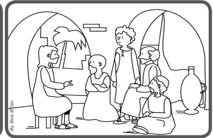
Depois Jesus chama os seus discípulos à parte e doa também a eles o poder de curar doenças. De graça recebestes, de graça deveis dar! (Mt 10,8).