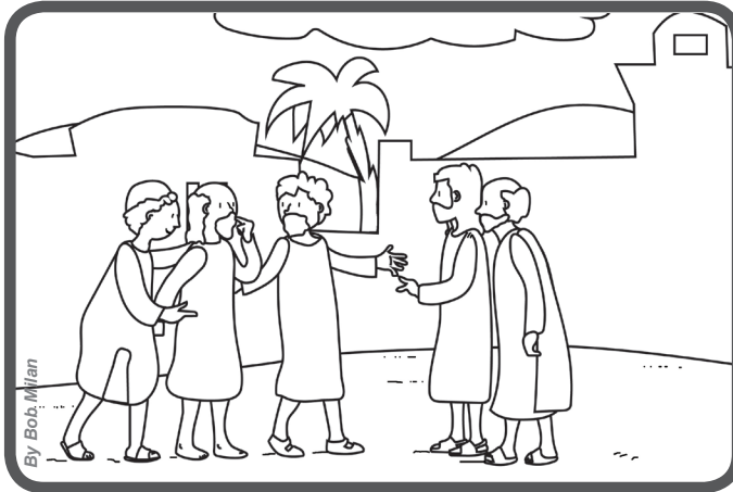
Levam a Jesus um homem mudo.

“De graça recebestes, de graça deveis dar!” (Mt 10,8)