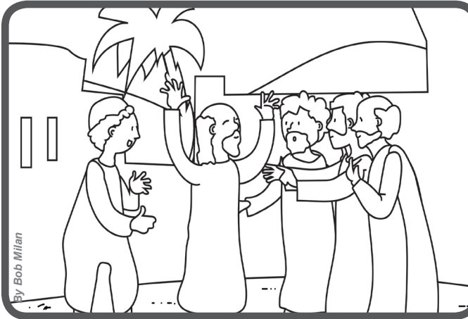
Jesus o cura e as pessoas dizem: nunca se viu algo igual! (Mt 9,32-33).