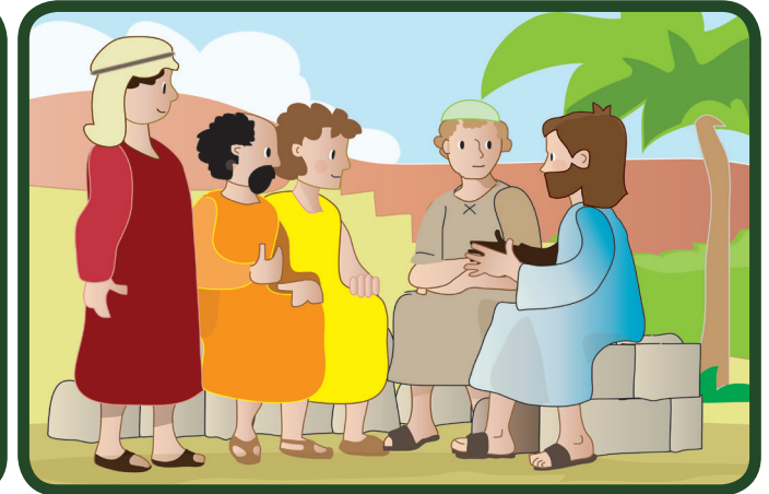
Jesus antwortet: „Siebenundsiebzig Mal“ und das heißt: unzählige Male, immer wieder! So verhält sich Gott und auch wir können Ihn nachahmen (vgl. Mt 18, 14, 21-22)