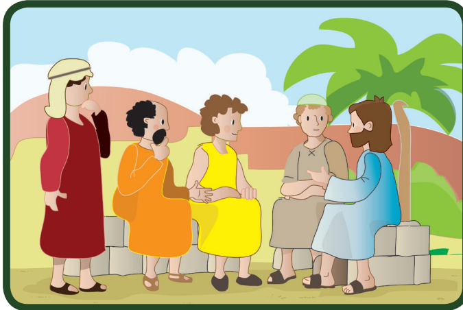
Jesus hat die Apostel und Jünger gelehrt, dass Gott Vater von allen Menschen ist. Darum sind wir alle Geschwister. Gott liebt uns alle unendlich und möchte, dass niemand verloren geht.

„Mit ewiger Liebe habe ich dich geliebt; darum habe ich dir die Treue bewahrt.“ (Jeremia 31, 3)