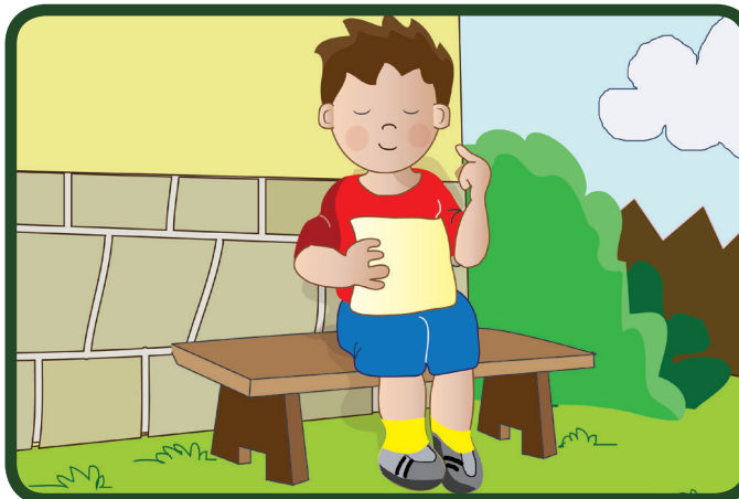
Eines Tages liest Jeremie im Wort des Lebens gelesen, dass Jesus sagt wir sollen immer verzeihen. Da denkt er: Sicher hat Jesus auch Jan verziehen. Dann muss ich das auch!