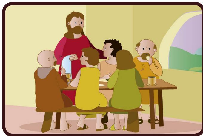
Während des letzten Abendmahls mit seinen Jüngern steht Jesus auf und nimmt ein Handtuch.

„Wenn ich, euer Herr und Meister, euch die Füße gewaschen habe, sollt auch ihr einander die Füße waschen.“ (Joh 13, 14)