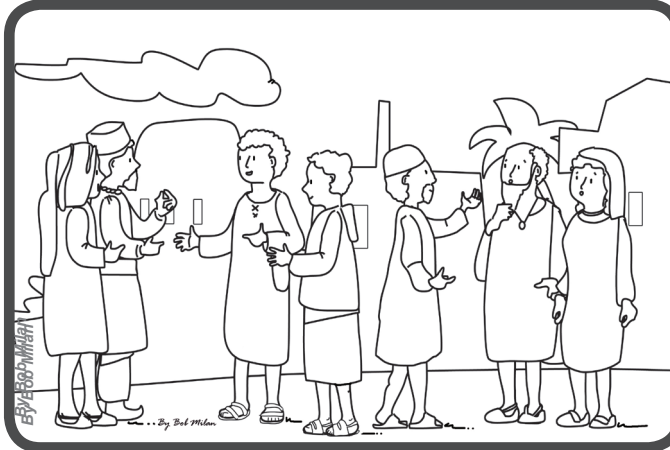
Dank des Heiligen Geistes sprechen die Apostel zu allen von Jesus.