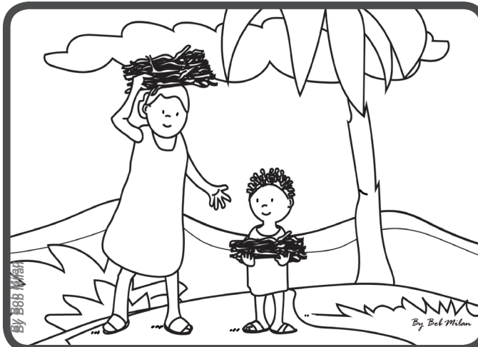
Eines Tages sah ich sie, wie sie mit einem Bündel Holz auf dem Kopf vom Feld zurückkam. Ich habe mich angeboten, ihr zu helfen, und nach einem ersten Zögern hat sie mich machen lassen.