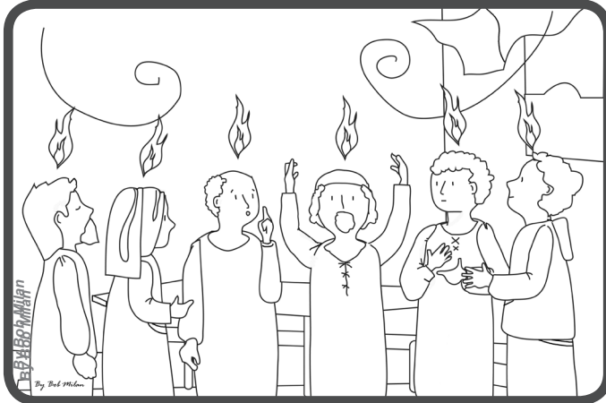
Nach Seiner Auferstehung hat Jesus, wie er versprochen hat, den Heiligen Geist auf die Apostel herab gesandt.

„Ihr werdet Kraft empfangen, wenn der Heilige Geist auf euch herabkommt, und ihr werdet meine Zeugen sein.“ (Apg 1, 8)