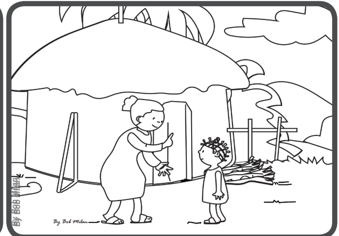
Ich hatte die Kraft sie bis nach Hause zu begleiten. Am Schluss hat sie gesagt „Gott segne dich.“ Ich war froh.