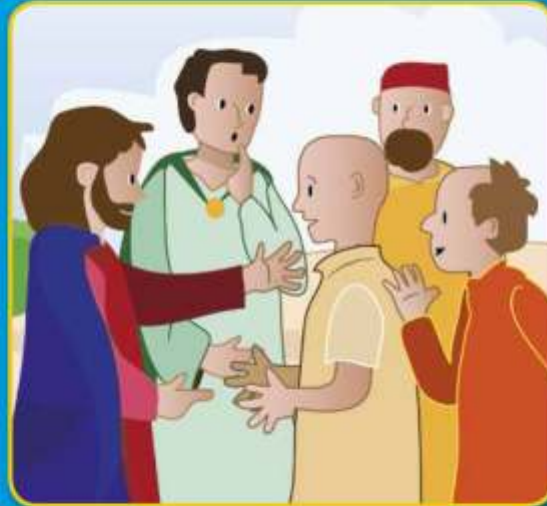
J zus j pagyd ir nebylys prakalb jo.