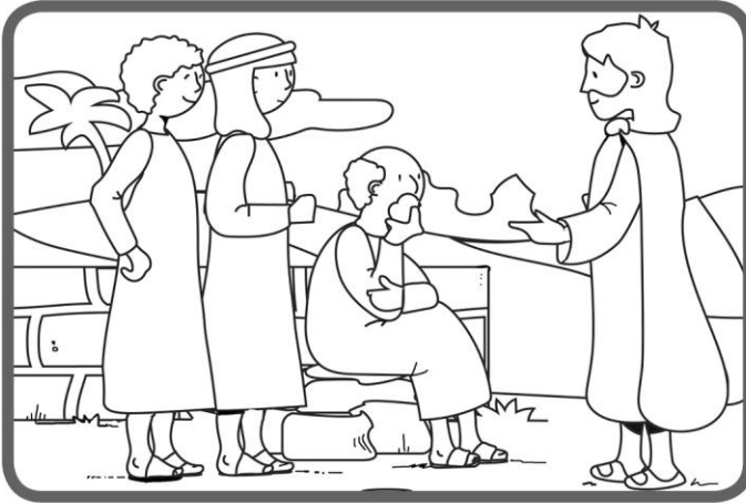
Jėzus aiškino savo mokiniams, kad Dievo teisingumas ir Jo begalinė meilė skirta visiems žmonėms.

„Tik to, kas teisu, teisingai tesieksi“ (Ist 16, 20).