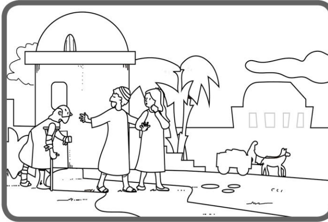
Bet net ir tais laikais daugybė žmonių kentėjo nuo didžiulės neteisybės: skurdo, laisvės nebuvimo.