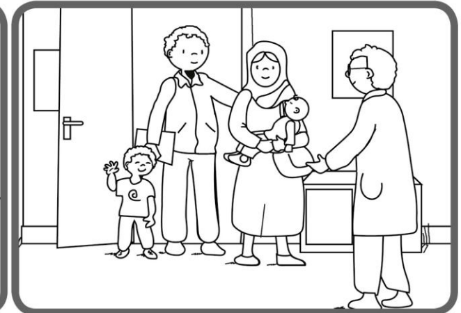
Tada aš jam tariau: „Tėti, kai nukeliausi į rojų, Jėzus tau pasakys: Tai man padarei “. Tėtis sutiko padėti, kartu su tuo vaiku ir mama nuėjome pas mūsų pažįstamą mediką. Po apžiūros visi atsisveikinome. Buvau labai laimingas.