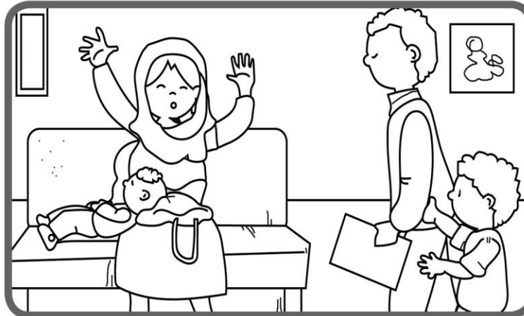
Išėję iš gydytojo kabineto sutikome vieną musulmonę moterį. Ji garsiai raudėjo, nes jos kūdikis sunkiai sirgo ir niekas ligoninėje nenorėjo jį priimti dėl konfliktų tarp musulmonų ir krikščionių. Mano tėtis taip pat praėjo pro ją lyg niekur nieko. Aš primygtinai prašiau, bet jis atsakė, kad dabar turi rūpintis manimi.