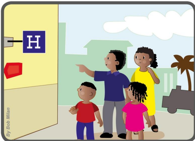
Gen 4 iš Tanzanijos sužinojo, jog daugelis sergančiųjų ligoninėje neturi muilo prausimuisi.