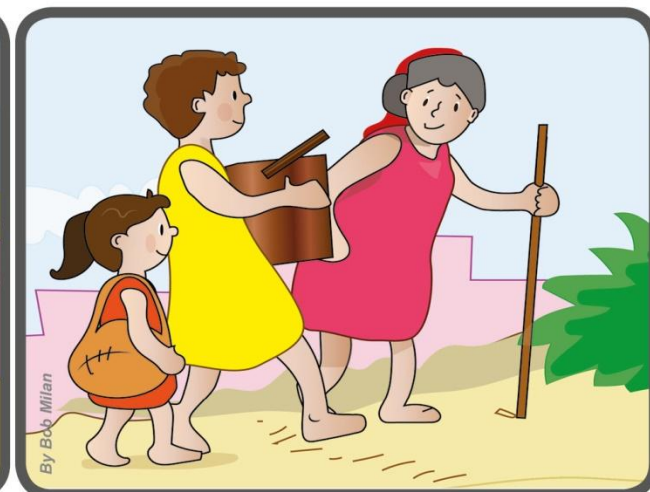
Pasilikdavo šalia jo, kantriai ir su meile padėdavo.