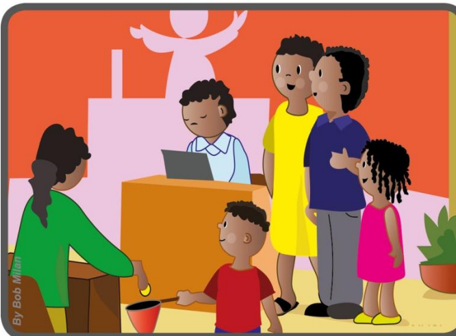
Kartu su suaugusiais jie giedojo Mišiose ir prašė paaukoti tiems ligoniams.