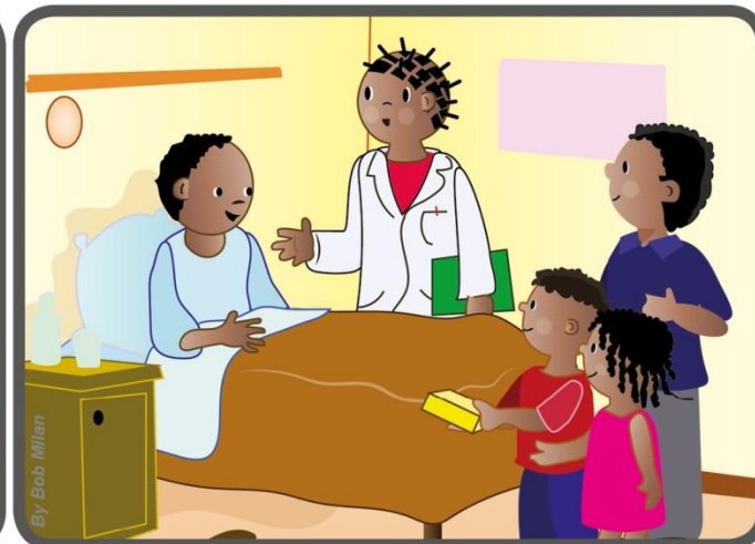
Paskui nuėjo į ligoninę ir nunešė muilo, kurį jiems nupirko.