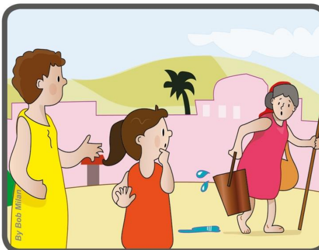
Jie bandė tai įgyvendinti praktiškai, ypač matydami, kad kažkam reikia pagalbos.