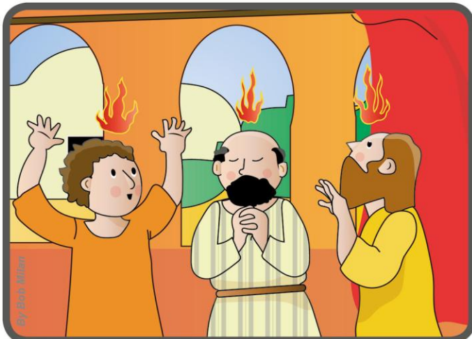
Kaip Jėzus buvo pažadėjęs, Jam Prisikėlus, ant apaštalų nusileido Šventoji Dvasia.

„Sergėk brangų patikėtąjį turta, padedamas Šventosios Dvasios, kuri gyvena mumyse“ (2 Tim 1, 14).