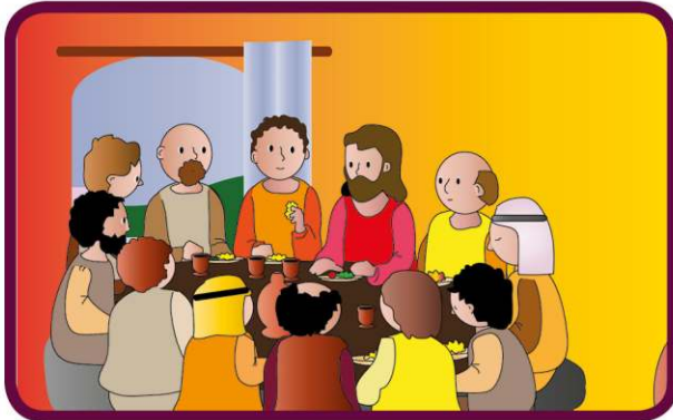
Jezus spożywa ostatnią wieczerzę ze swoimi uczniami.