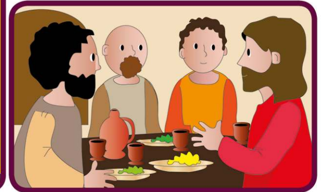
Aby im pomóc, Jezus mówi: „Pokój zostawiam wam, pokój mój daję wam”. (J 14, 27)