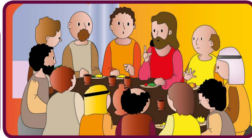
Mówi im, że wkrótce ich opuści, aby powrócić do Nieba, do Ojca, ale uczniowie są smutni i nie chcą, aby odszedł.