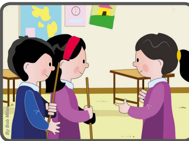
Pewnego ranka Andreane zauważyła, że w grupie wykonującej tę pracę było mało osób. Podeszła więc i z uśmiechem powiedziała: „Mogę wam pomóc!” a potem wzięła mop