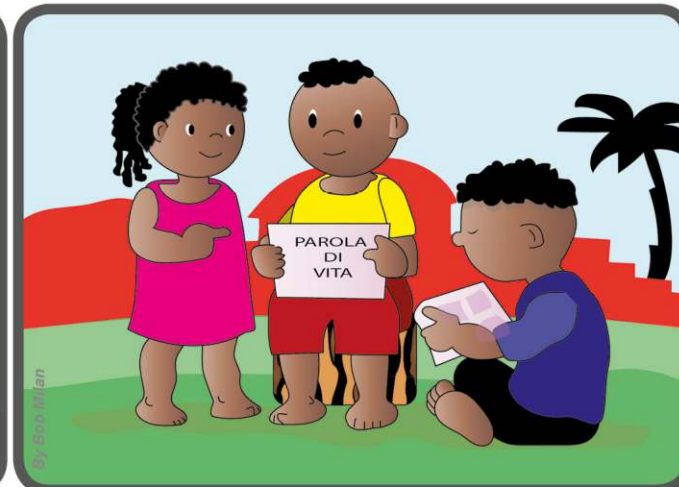
Wydarzenia z Jego życia i Jego słowa zostały następnie zapisane, a Ewangelia dotarła do nas poprzez Kościół, abyśmy mogli żyć i głosić przesłanie miłości Jezusa.