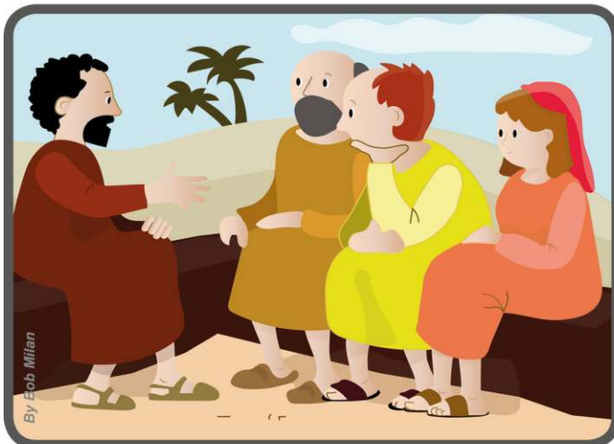
Św. Paweł z Tarsu, który poznał miłość Jezusa, zachęca chrześcijan, aby żyli jak On, kochając wszystkich.

„Weselcie się z tymi, którzy się weselą, płaczcie z tymi, którzy płaczą” (Rz 12,15)