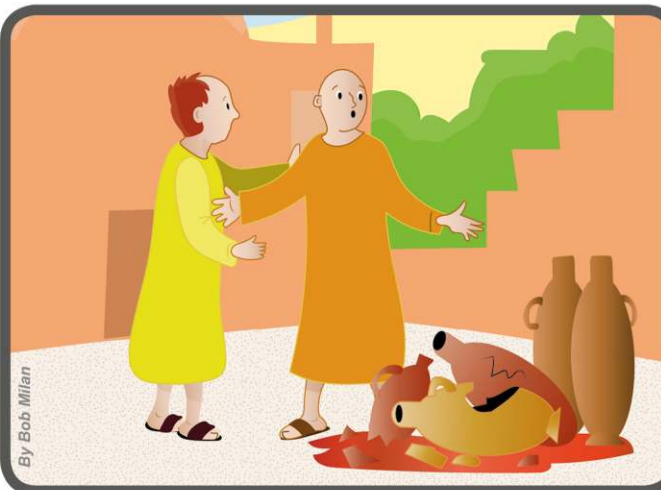
Możemy „wejść w skórę drugiego” i radować się z tymi, którzy są szczęśliwi i pocieszać tych, którzy są smutni.